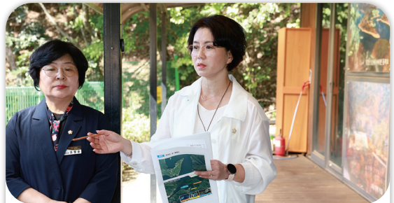
이서 망향정 주변 관광기반시설 정비사업 현장방문