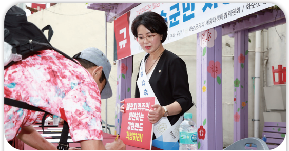
강원랜드 폐광기금 과소징수분 부과처분 취소소송 취하 화순군민서명운동