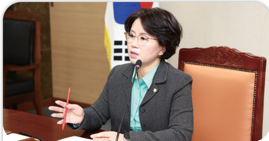
의원 연구단체 최종결과보고서 (빈집활용연구회)