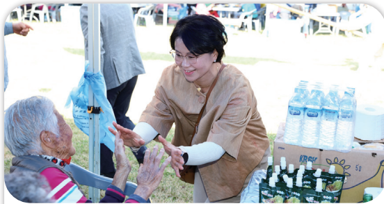
백아면민의 날 기념 화합 한마당 및 경로위안잔치