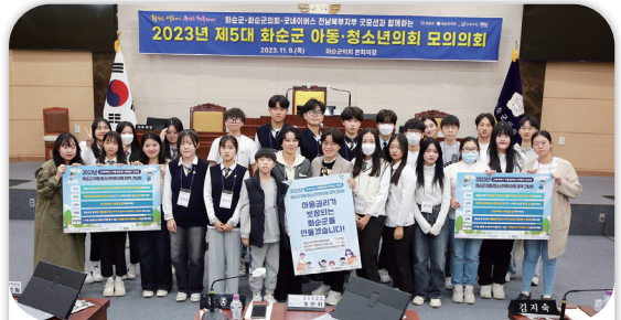
화순군-화순군아동청소년의회 간담회 및 모의회의