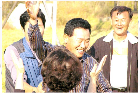
△ 삼계중 6회동창회 친구들과 함께