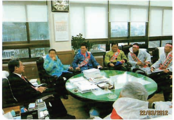
해남군수를 찾아 신안에 막대한 피해를 주는 화력발전소 건립반대를 위해 투쟁