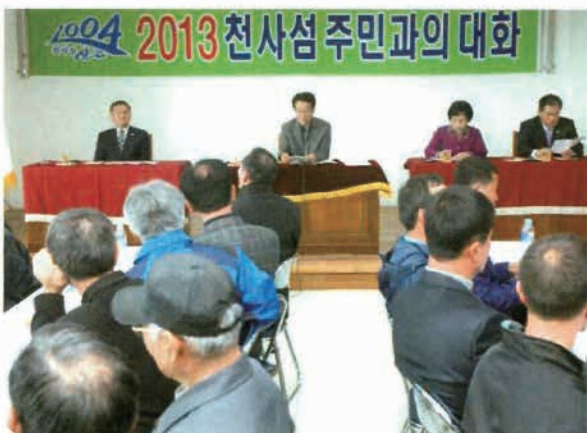
천사섬 주민과의 대화 향상 소통하는 의정활동을 추진함