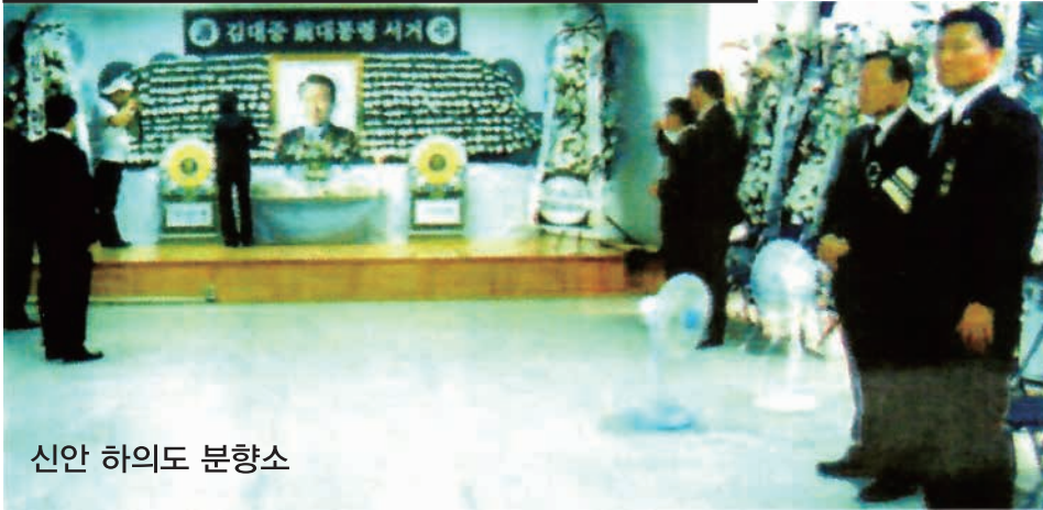
신안 하의도 분향소