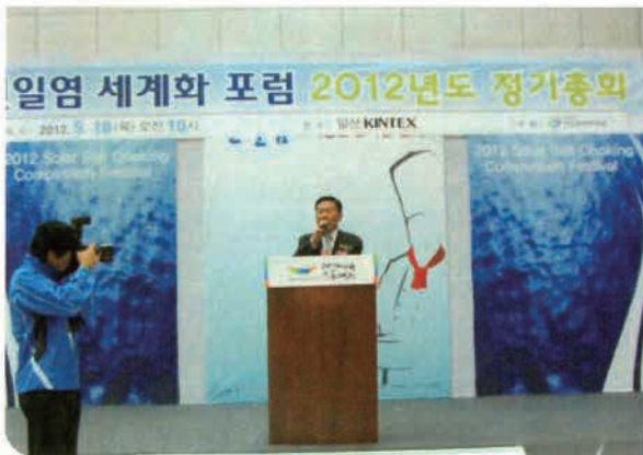
천일염 세계화포럼 기념사