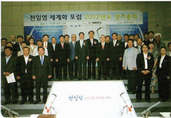
천일염 세계화포럼(일산 킨텍스)