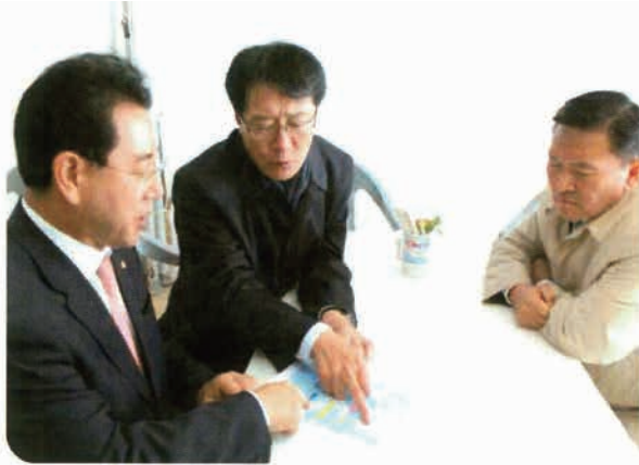
김영록 장관에게 북룡-신장4차선 설명하고 예산부탁을 하고있다.