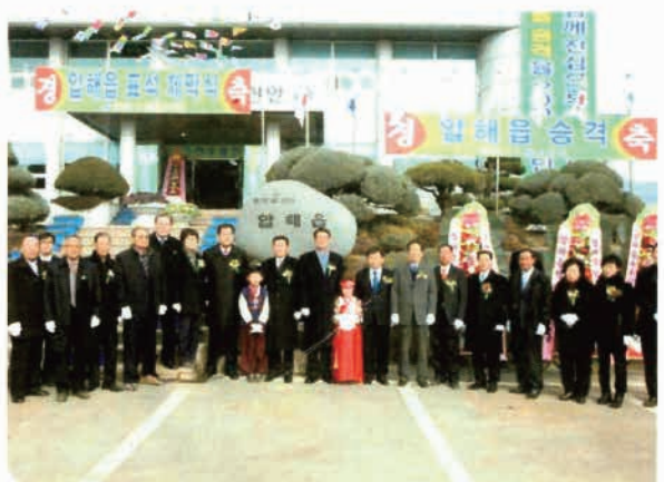
압해읍 승격 표석 제막식사