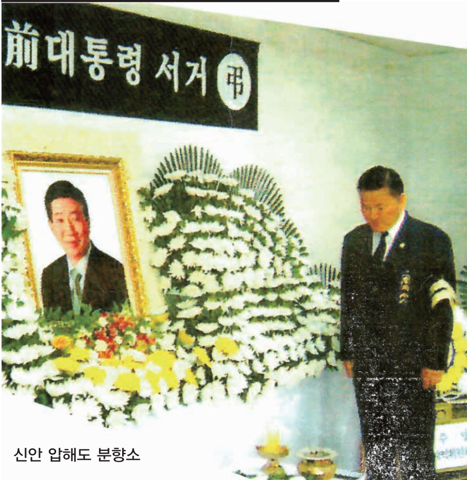
신안 압해도 분향소