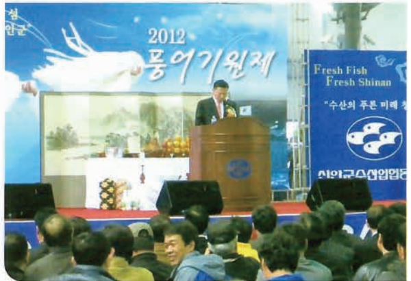
수산의 미래는 신안의 미래이기도 하다. 신안군은 수산 발전에 전력을 다해야 한다.