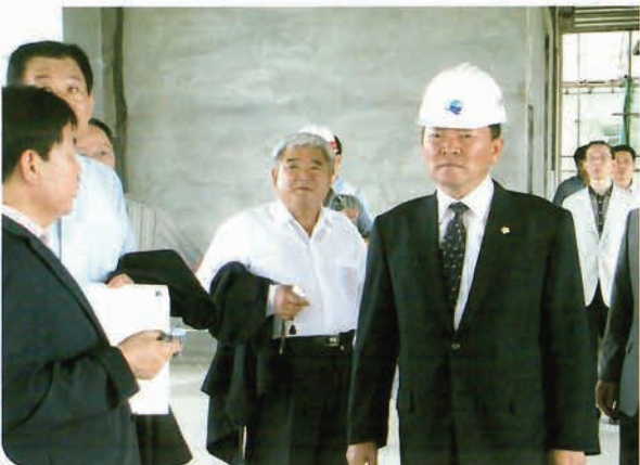
의회활동을 현장 중심의회로 전환했던 시절 직접 현장확인으로 많은 성과를 이룸