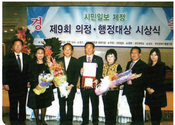
시민일보 제정 제9회 의정행정대상 시상식