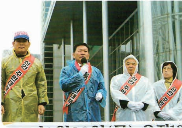
해남화원에 화력발전소 건립 반대집회에 참여하여 강력히 반대의견을 주장