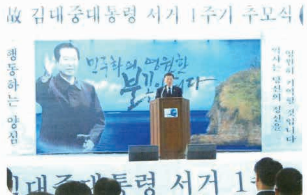
김대중대통령 서거1주년 행사 기념사