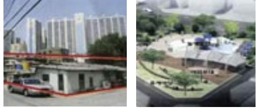
2 연지동 주택가 어린이공원 조성사업