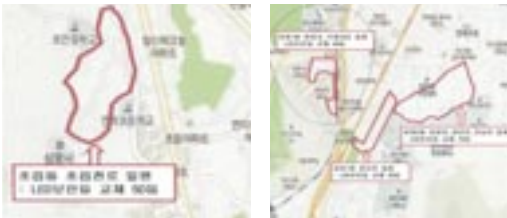
9 양정동 초읍동일원 노후보안등 정비