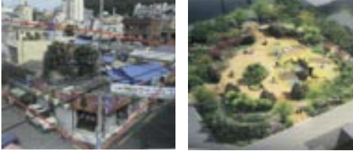
1 양정2동 주택가 어린이공원 조성사업