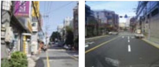
7 하수관거 개보수