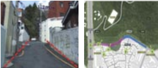
3 초읍동 산복도로 개설 재개