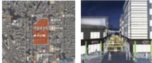
8 서면 특화거리 조성사업