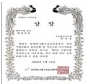
한국매니페스토실천본부 약속대상 최우수상