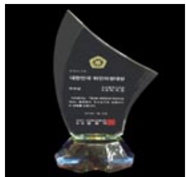
전국 시·도의회 의장협의회 대한민국위민의정대상