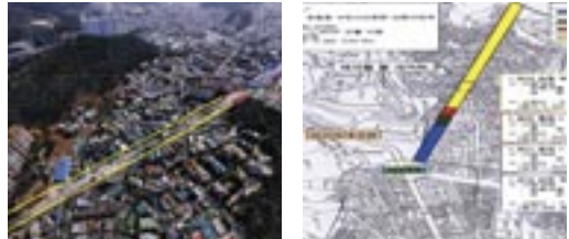
6 초읍동 도로개설 (대공원R ↔ 삼환대진APT)