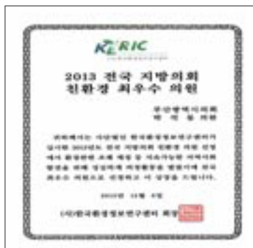
(사)한국환경정보연구센터 친환경 최우수 수상