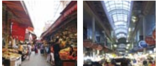
4 부전시장 내 아케이드 및 현대화 마케팅사업