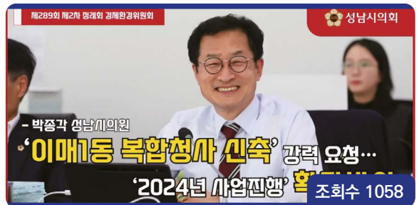
[위원회 질의] 이매동 복합청사 신축 강력 요청 (제289회 2차 정례회 / 2023.11.24)