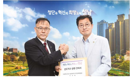
분당 선도지구 관련 건의서 전달(2025년)