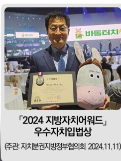
「2024 지방자치어워드」 우수자치입법상 (주관: 자치분권지방정부협의회 2024.11.11)