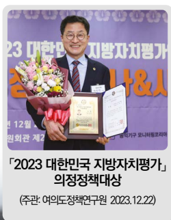
「2023 대한민국 지방자치평가」 의정정책대상 (주관: 여의도정책연구원 2023.12.22)