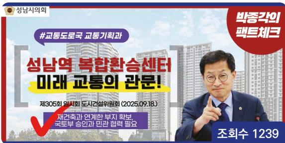
[위원회 질의] 성남역 복합환승센터 미래 교통의 관문 (제305회 임시회 / 2025.09.18)