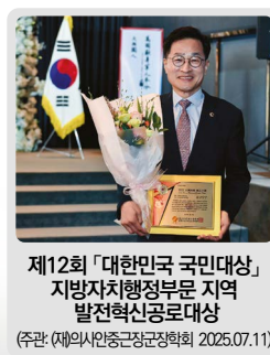
제12회 「대한민국 국민대상」 지방자치행정부문 지역 발전혁신공로대상 (주관: (재)의사인중근장군장학회 2025.07.11)