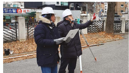
이매1동 복합청사 착공식 참석 및 현장 점검(2025.02.05)