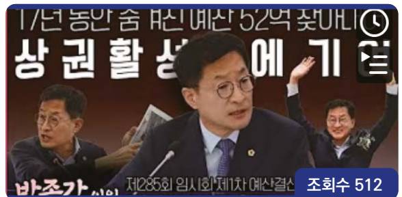
[부시장 질의] 성남시 숨겨진 예산 52억 재정에 활용, 성남시 상권활성화 기어 (제285회 임시회 / 2023.09.18)