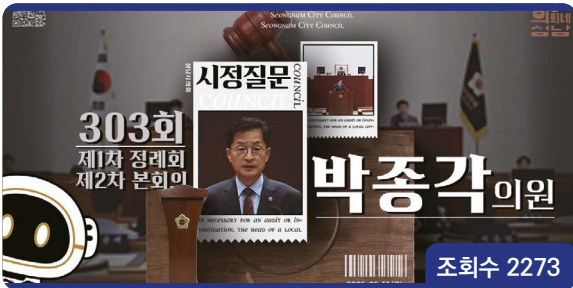
[시정질의] 제303회 제1차 정례회 제2차 본회의 (2025.06.13)