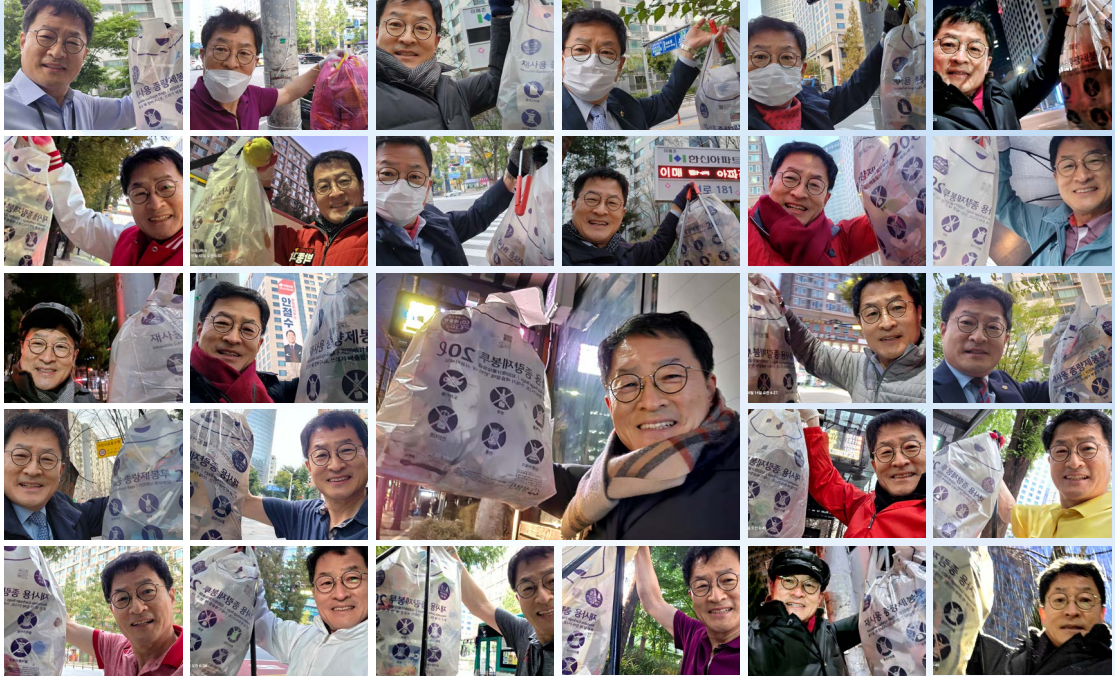
매주 월요일 새벽, 서현역 AK백화점 앞에서 시민의 한 주를 여는 청소 활동을 이어왔습니다.(2022년 7월 부터 현재 [2026년 5월 16일기준])

여러분의 선택이 더 나은 성남을, 우리 동네 이매, 삼평동 을 향한 걸음을 멈추지 않게 합니다.