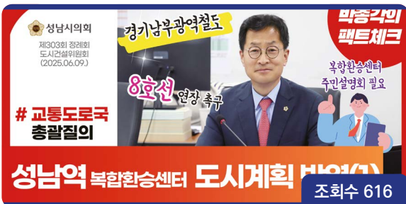
[위원회 질의] 성남역 복합환승센터 도시계획 반영 (제303회 정례회 / 2025.06.09)