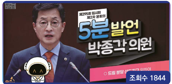
[5분발언] 드림 분당 선도지구 위하여 (2024.07.22)