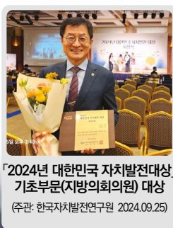
「2024년 대한민국 자치발전대상」 기초부문(지방의회의원) 대상 (주관: 한국자치발전연구원 2024.09.25)