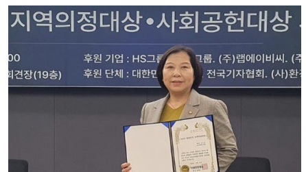
[2025 대한민국 지역의정대상 사회공헌 대상 수상]