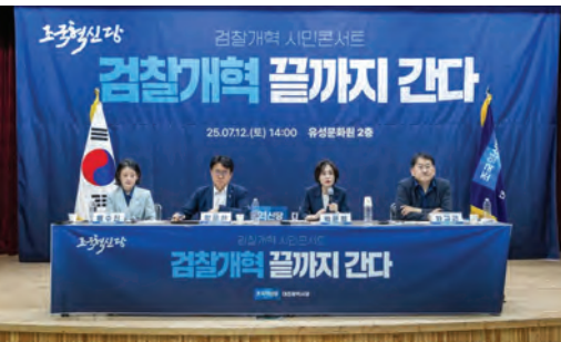
25.07.12. 조국혁신당 검찰개혁 시민콘서트