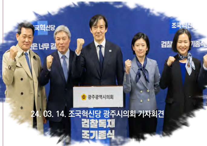
24. 03. 14. 조국혁신당 광주시의회 기자회견