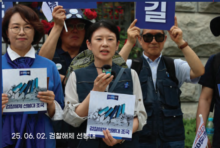
25. 06. 02. 검찰해체 선포대