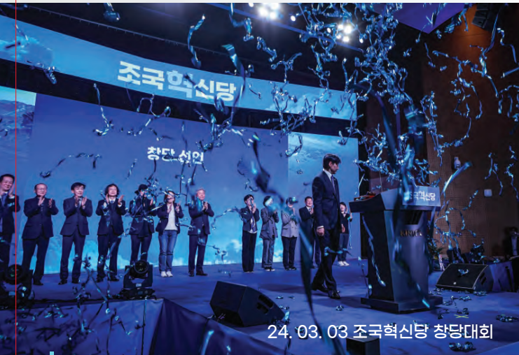
24. 03. 03 조국혁신당 창당대회