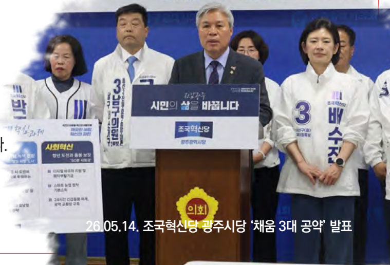
26. 05. 14. 조국혁신당 광주시장 '채움 3대 공약' 발표