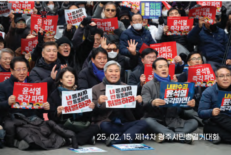
25. 02. 15. 제14차 광주시민총력거대회