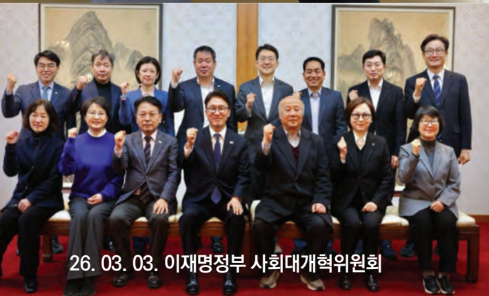
26. 03. 03. 이재명정부 사회대개혁위원회