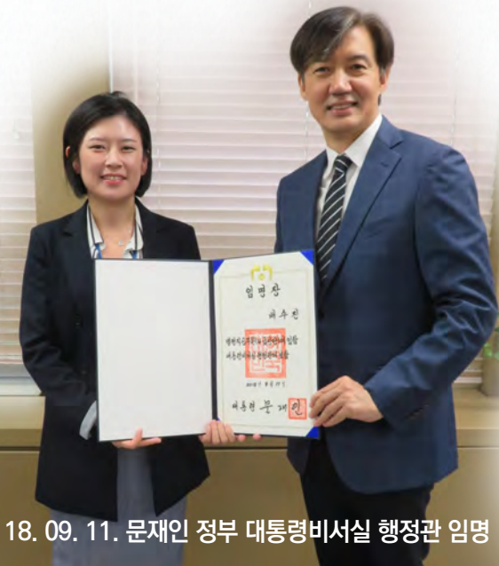
18. 09. 11. 문재인 정부 대통령비서실 행정관 임명

조국 대표와 함께 조국혁신당의 문을 열었습니다. 이제 광주가 보내주신 압도적인 사랑을 광산의 확실한 변화로 보답하겠습니다!