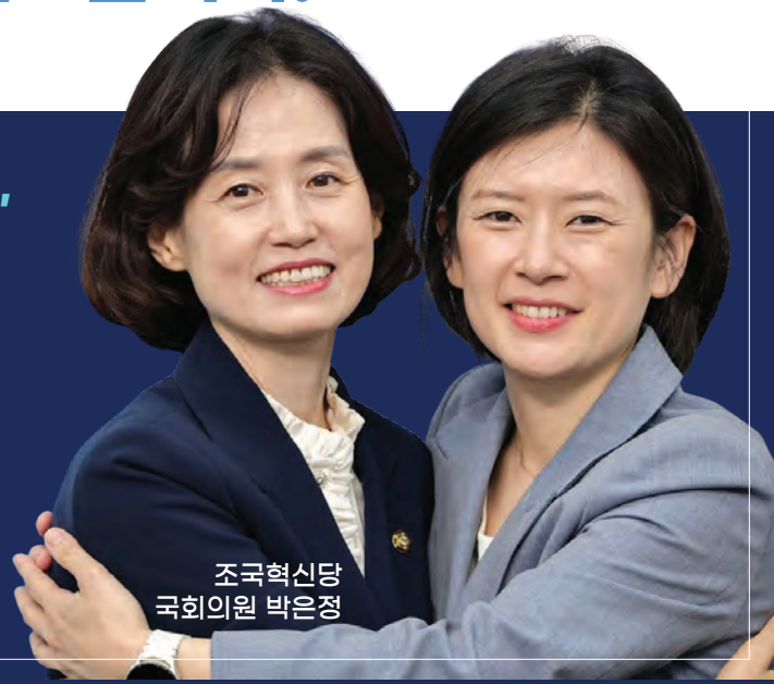
조국혁신당 국회의원 박은정