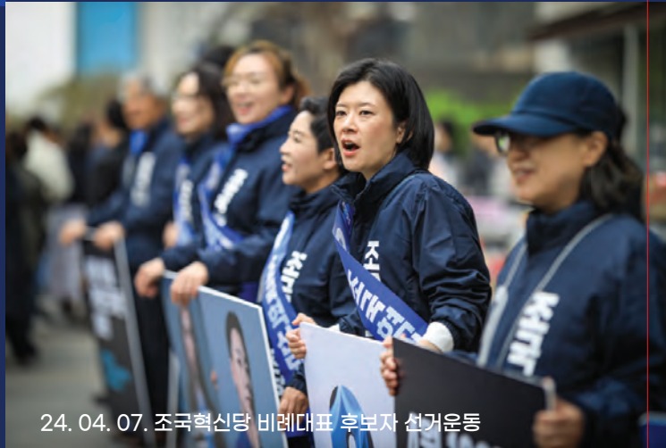
24. 04. 07. 조국혁신당 비례대표 후보자 선거운동