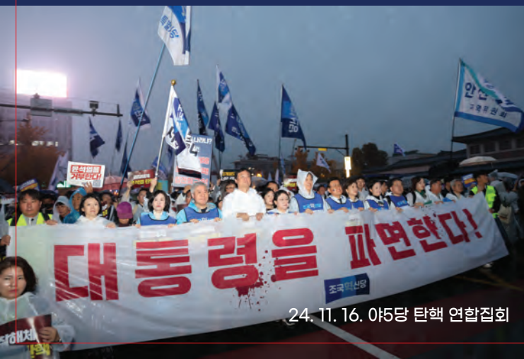
24. 11. 16. 야5당 탄핵 연합집회