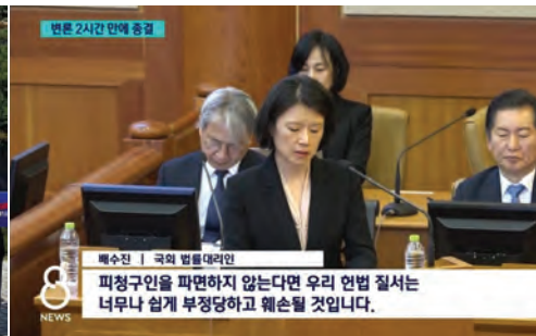
25.03.18 박성재 전법무부장관 탄핵사건 국회측 대리