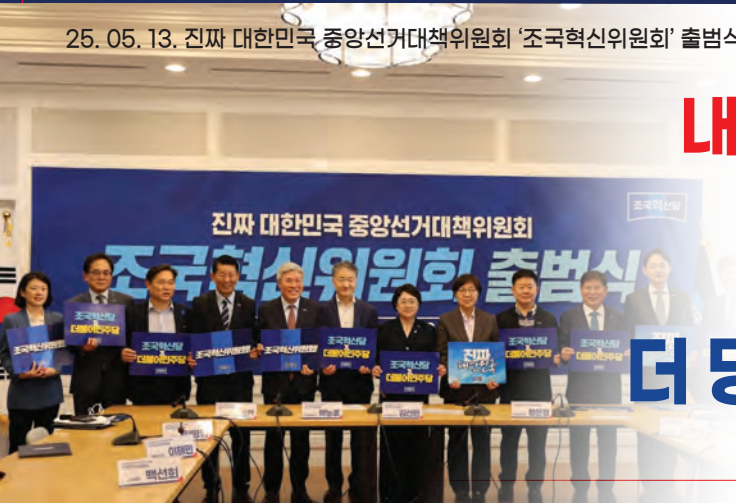
25. 05. 13. 진짜 대한민국 중앙선거대책위원회 '조국혁신위원회' 출범식