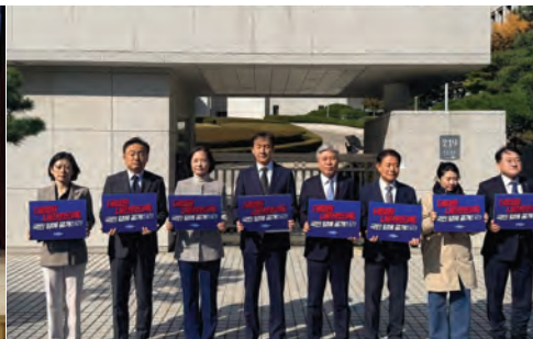
25.10.28. 조희대 대법원장 사퇴 촉구 기자회견