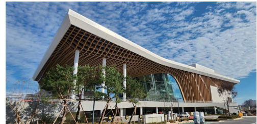
평택아트센터 사진 참고