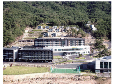
경찰청 제천수련원 사진 참고