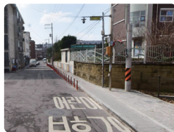
보도연결 및 대기공간 설치