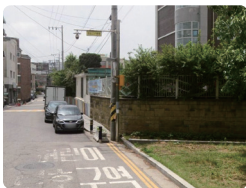
보도 단절 구간