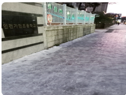
보도열선 설치 전