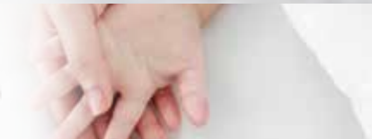
[통합돌봄 체계 구축]