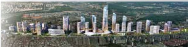
[조차장역 복합개발 확정]