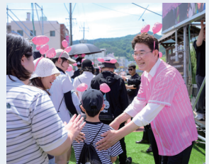
문화콘텐츠 기업 여수 MBC, 순천에 오신 것을 환영합니다