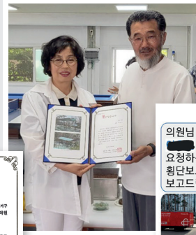
사랑의 전원마을 제25103호 제목: "고맙습니다" 삼송1동 사랑의 전원마을 속원사업 주민 감사패 수상 (25. 06. 08)