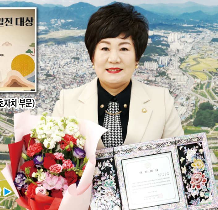
▶ 제천시의회 최초 의정대상