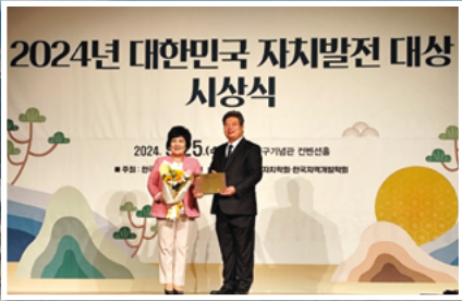
▲ 대한민국 자치발전 대상(기초자치 부문)