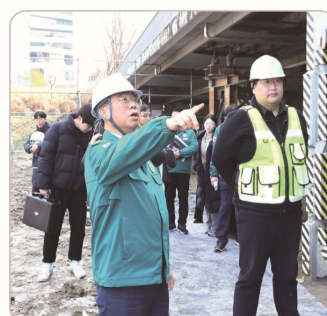
수내교 안전점검 (2024. 1.18)