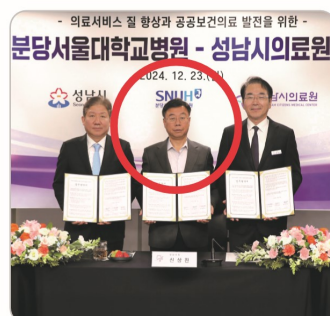
성남시의료원 활성화 업무협약 (2024. 12. 23)