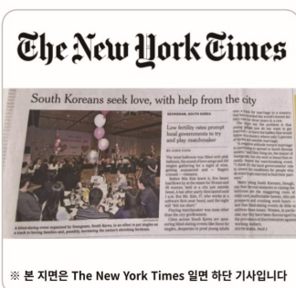
※ 본 지면은 The New York Times 일면 하단 기사입니다