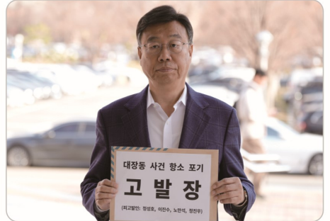
김만배 일당 항소포기 책임자 정성호 법무장관 등 고발

01 '빛 없는 도시' 달성 - 채무 2,400억 조기상환 했습니 다 (민선8기)