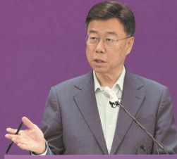
성남시 성남시장 신상진

07 도심 속 힐링, '대원천 복원 및 생태하천' 조성 성남의 물길을 되살려 시민에게, 쉽표가 있는 명품 생태 도시. • 복개된 대원천을 생태하천으로 복원하여 수변 산책로와 녹지 공간 조성