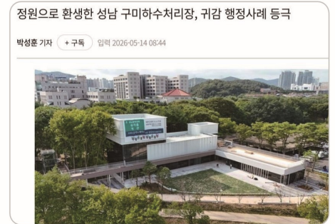
문화일보 (2026. 5.14)