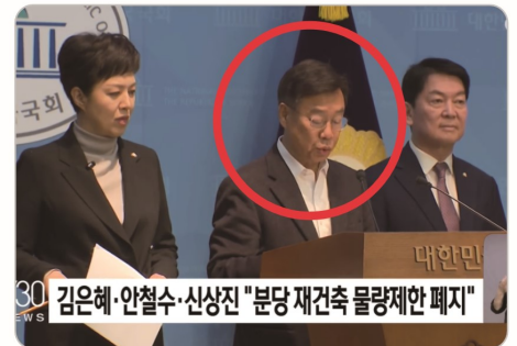
분당재건축물량제한 폐지 촉구 기자회견 (2026. 2.19 국회 소통관)