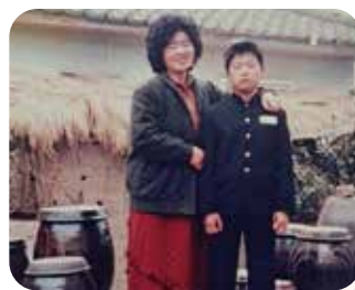
(고)사랑하는 어머님과 함께