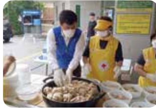
어르신 삼계탕 대접 행사