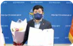
의용소방대 지원조례재정 행정안전부 장관상 수상