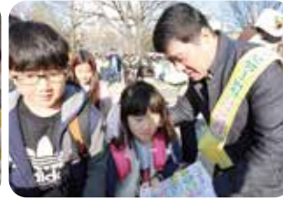
스쿨존 합동 교통 캠페인