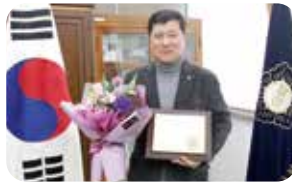
대한민국 칭찬 봉사대상