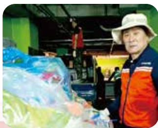
작전1동 최강마트 비 피해 봉사활동

생활체육시설 정비와 생활 SOC 확충. 문화센터·주민 쉼터·소규모 문화공간까지. 쉬고 즐기고 머물고 싶은 계양을 만들겠습니다.