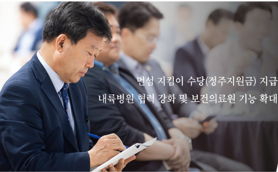
면섬 지킴이 수당(정주지원금) 지급 내륙병원 협력 강화 및 보건의료원 기능 확대