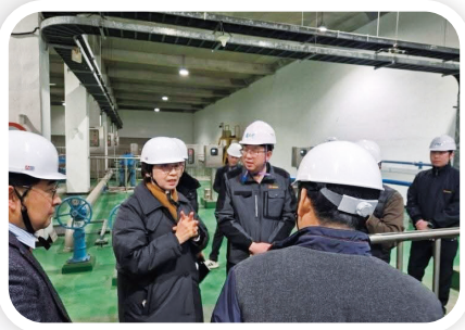
IoT 기반 스마트안전보건 통합관리시스템 구축