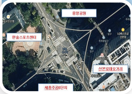
한솔사거리 대각선횡단보도 설치사업