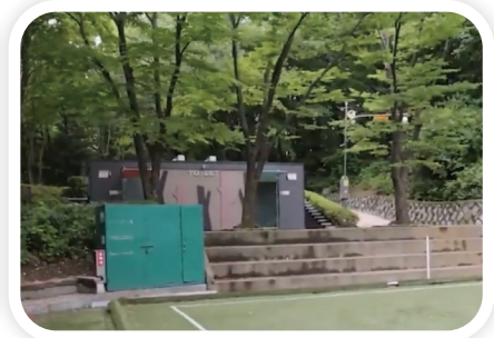
궁내근린공원 화장실 설치사업