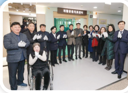
장애인 재활운동치료실 확대 이전