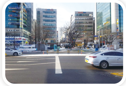
교통안전시설물 설치 및 정비사업