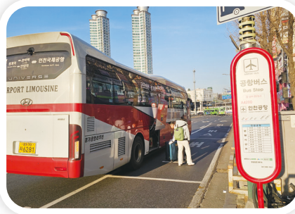
공항버스 노선 확대: 금정역 정류소 추가