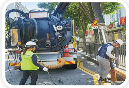
군포시 도시침수 대응 하수도 시설물 정비사업