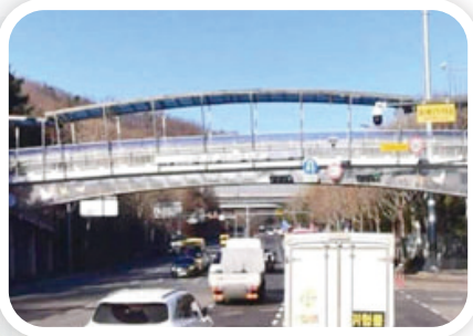
산본IC 보도육교 경관개선 사업