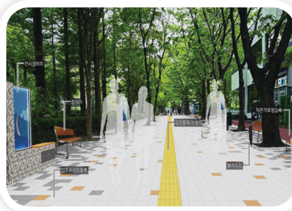
궁내동 문화의 거리 재정비 사업