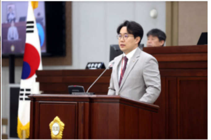
수원시 버스 노선 전면 개편 촉구