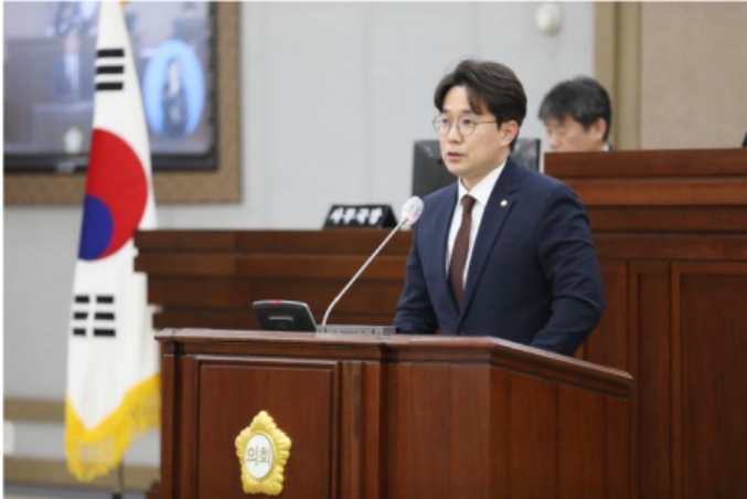
망포역세권 복합개발사업 대책 마련 촉구