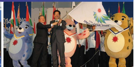
2014 인천아시안게임 성공 개최 준비