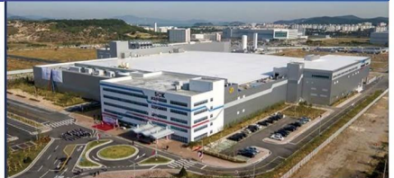
반도체기업 스텔츠칩팩코리아 유치