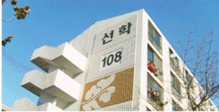
선학동 시영아파트 승강기 설치