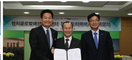
형지패션(크로커다일) 본사 유치