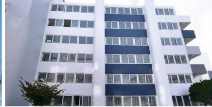
선학·연수 임대아파트 노후시설 개선