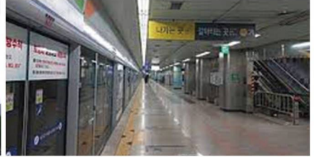
연수내 주요역 승강기 및 스크린도어 설치 주도