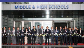
채드워 송도국제학교 개교 주도