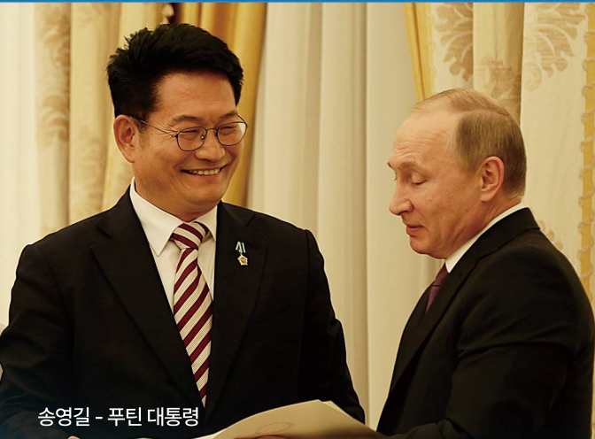
송영길 - 푸틴 대통령