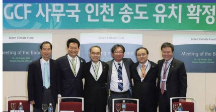
GCF(녹색기후기금) 사무국 유치