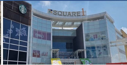
대형 복합쇼핑몰 '스퀘어원' 유치