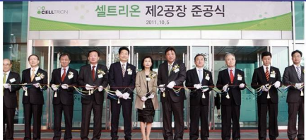
셀트리온 제2공장 증설 지원