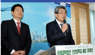
인천대학교 국립대학법인 전환