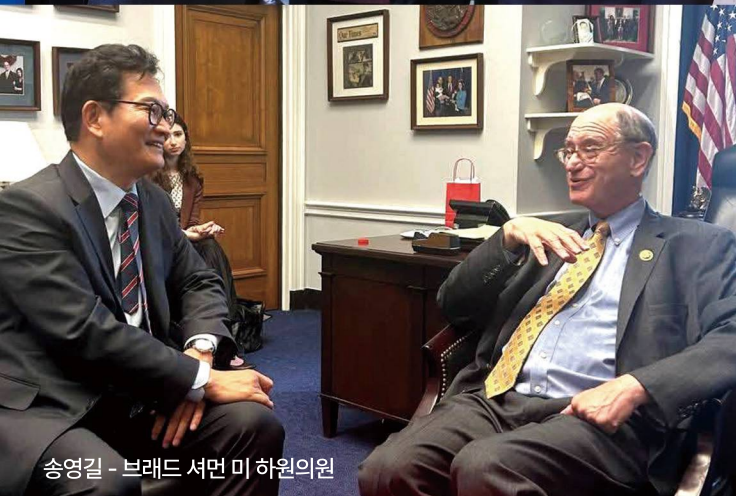
송영길 - 브래드 셔먼 미 하원의원

인천 경제와도 떼려야 뗄 수 없는 중요한 파트너입니다. 인천 경제를 위해, 대한민국의 미래를 위해 중국과의 실용외교로 대한민국의 이익과 인천의 미래를 지키겠습니다.