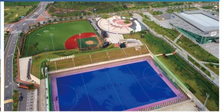
선학경기장 부지 확보