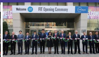
대한민국 최초 해외 명문 글로벌 캠퍼스 유치 (뉴욕주립대, 조지메이슨대, 유타대, 켄트대, 뉴욕패션기술대학교)