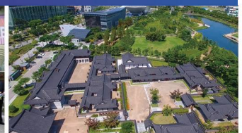
송도 한옥마을·경원재 조성