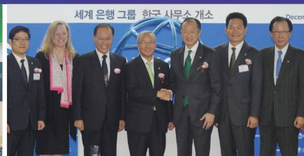
세계은행(World Bank) 한국사무소 유치