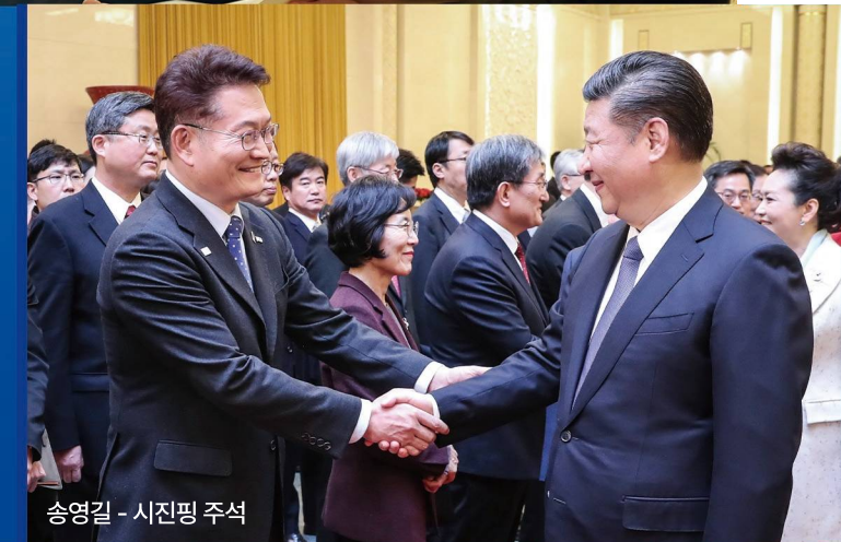
송영길 - 시진핑 주석

북방경제협력위원장으로 북방경제의 청사진을 그렸습니다. 러시아와의 외교 강화로 에너지와 물류의 길을 넓히고 북극항로를 개척하고 한러 관계를 복원하겠습니다.