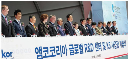
반도체기업 엠코테크놀러지 유치