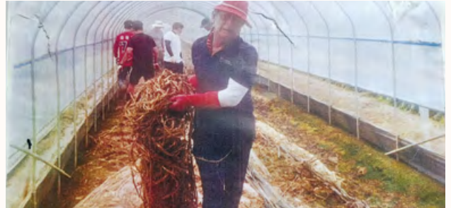
익산 농가 수해복구