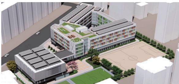
청담고등학교 이전 개교