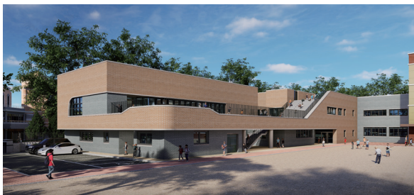
방배중·반원초 급식실·학생식당 준공 예산 확보