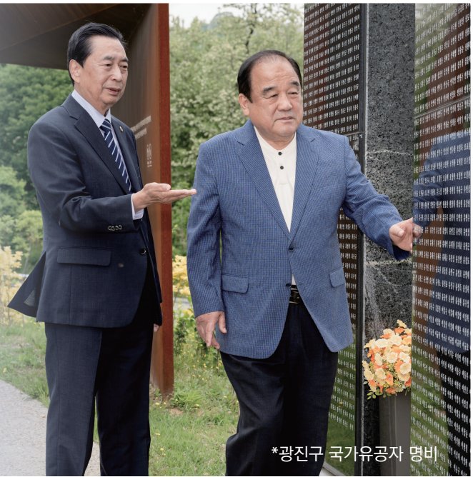
*광진구 국가유공자 명비