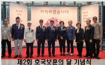
제2회 호국보훈의 달 기념식

우리 대한민국을 지키기 위해 희생한 모든 보훈단체와 국군장병 여러분들 깊이 감사드립니다.