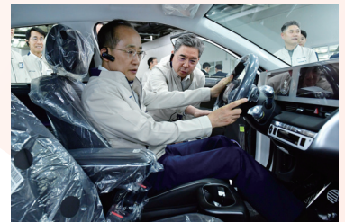
230509_현대차 울산공장 현장

- 불량률 제로 도전! 정밀기계·부품 산업 'AI 자율 공장' 단계적 도입