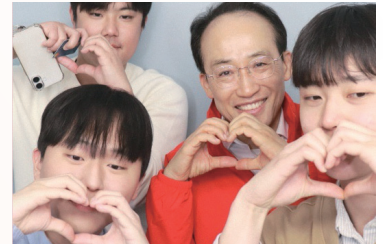
260411_교동거리에서 만난 청년들과 함께