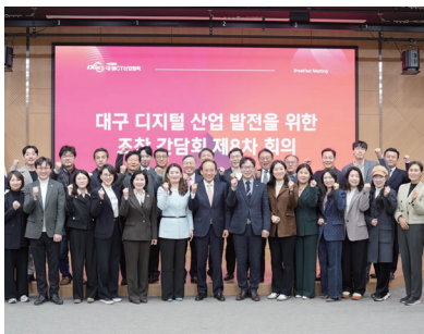
260319_대구 디지털 산업 발전을 위한 조찬간담회