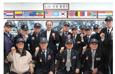
260403_6.25참전유공자회 대구지부 방문