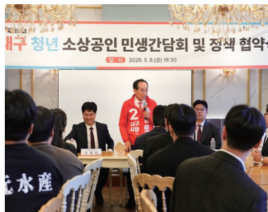
260508_대구청년 소상공인 민생간담회