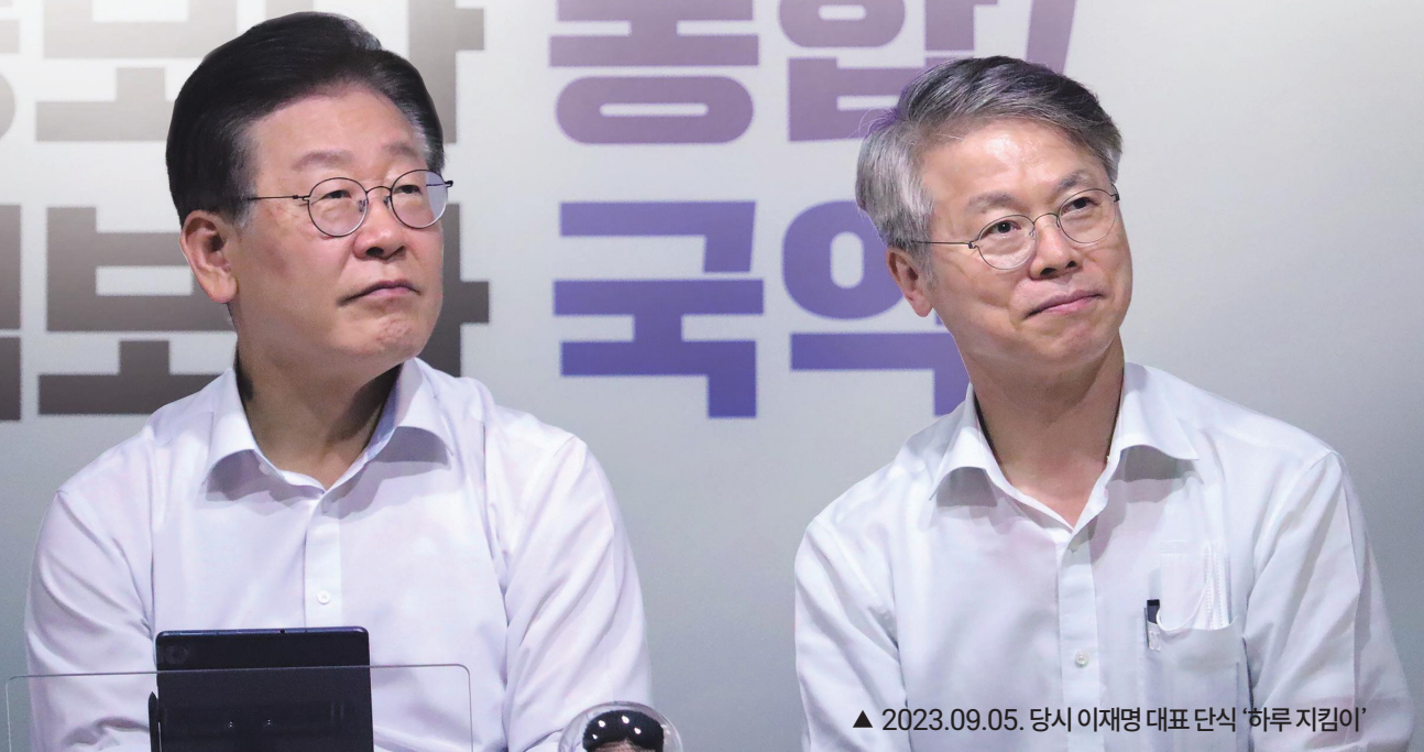
▲ 2023.09.05. 당시 이재명 대표 단식 ‘하루지킴이’

전남광주의 헌신에 걸맞은 미래, 대통령의 지원을 지역의 대도약으로 바꿀 준비된 계획, 민형배가 시민 여러분과 함께 현실로 만들겠습니다.