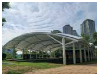
하북대근린공원(복대두진하트리움 옆) 운동시설 등