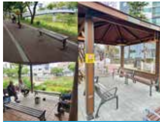
하북대 현대1차 옆 가경천 휴게공간