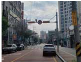
하트리움시티파크 안전한 통학로