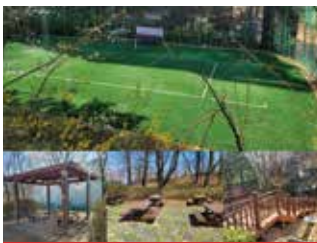
연초근린공원(금호어울림 옆) 공원시설, 수목 등