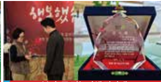
봉명1동 직능단체 감사패