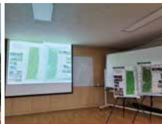
복대근린공원(청주고 옆) 정기미집행공원 전면 재정비