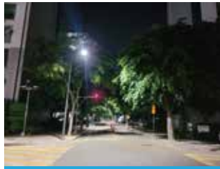
복대동대원칸타빌 통과도로 가로등