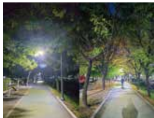
가경천 산책로 가로등