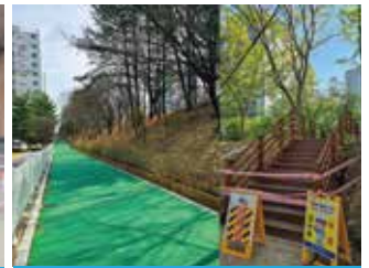
하북대백산-세원테마빌 완충녹지 관목-계단