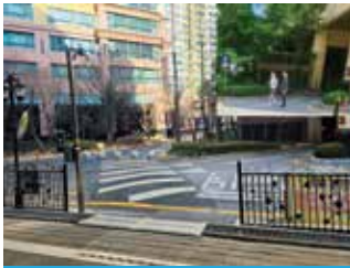
지웰시티1차 안전한 보행환경