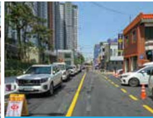
청주SKVIEW자이 후문 맞은편 인도 공간