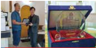
북대동 상인연합회 감사패