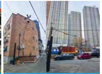
복대자이더스카이 안전한 통학로