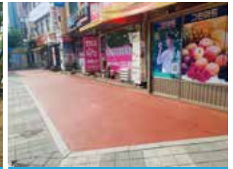
하북대현대2차 전면 도로 인도