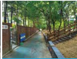
하북대삼일-아름다운날2차 연결 산책로