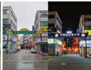
하북대전통시장 입구 조형물