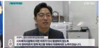
CJB 8 뉴스