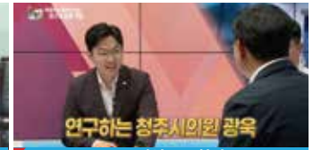
HCN 리얼트크 한판