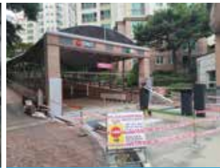
신영지웰홀즈 침수 방지 시설