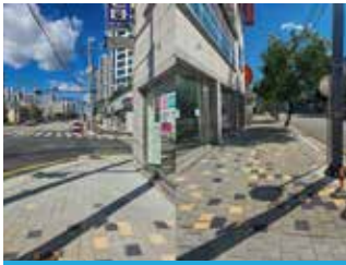
더샵청주센트럴 복대사거리 방면 인도