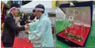
북대1동 축제추진위원회 감사패