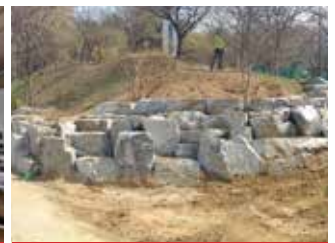
진재근린공원(현대2차 맞은편) 토사유출 방지