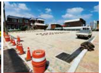
봉명1동 204-13번지 일원 주차장