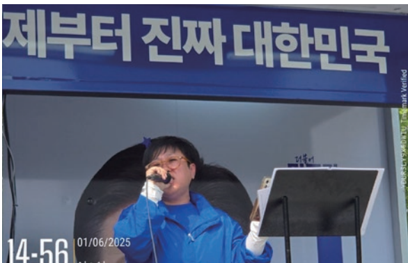
이재명 대통령 후보 대선 유세운동