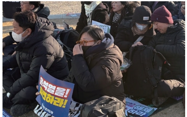
윤석열 탄핵집회 시위 참여