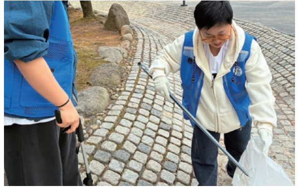
깨끗한 동네만들기 봉사활동