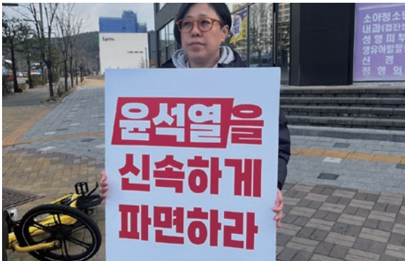
윤석열 파면 1인시위