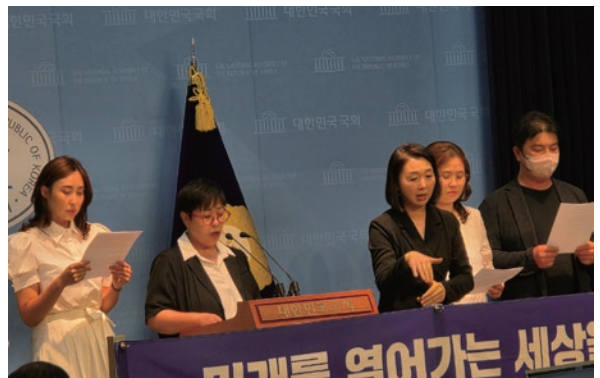
동탄의 정치하는 엄마,아빠 181명 이재명후보 지지선언 국회 기자회견