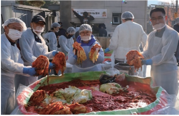
주민센터 김장나눔 봉사