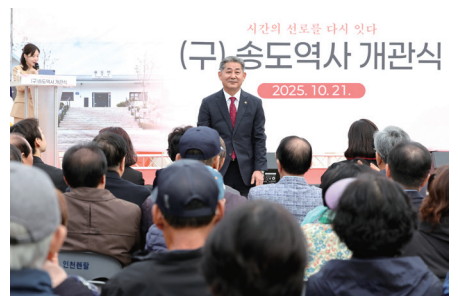
(구)송도역사 복원 사업 약 16.9억원 예산