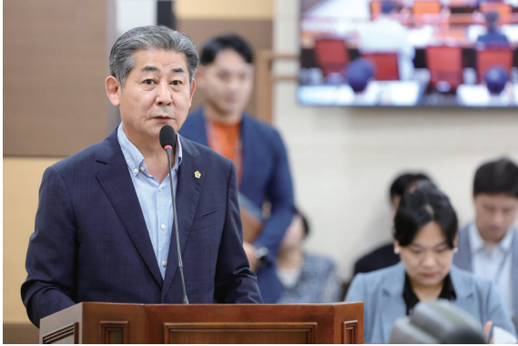
제303회 인천광역시의회 임시회 건설교통위원회에서 GTX-B 추가 정거장 관련 설명 장면

의장 취임 이후 GTX-B 추가정거장 확정 촉구 결의안을 대표 발의·통과 시키고, 타당성조사 예산 3억 2천만 원을 반영 해 사업 추진 기반을 마련하였습니다. 이에 따라 청학역 신설 을 전제로 한 설계가 진행되고 있습니다. 아울러 2026년 12월 개통 예정인 인천발 KTX 사업을 면밀히 점검하며, GTX-B와의 연계 통한 광역 교통망 구축을 지속적으로 추진 하고 있습니다.