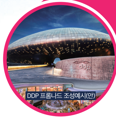
DDP 프롬나드 조성예시(안)