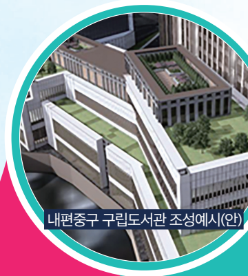
내편중구 구립도서관 조성예시(안)

동국대학교 인근에는 ‘내편중구’ 구립 도서관을 광희동에는 ‘이순신’ 구립 도서관을 조성하여 중구민의 지식생산 활동을 지원하겠습니다.