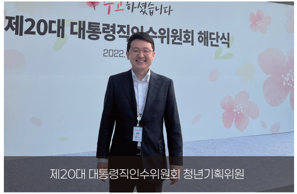
제20대 대통령직인수위원회 청년기획위원