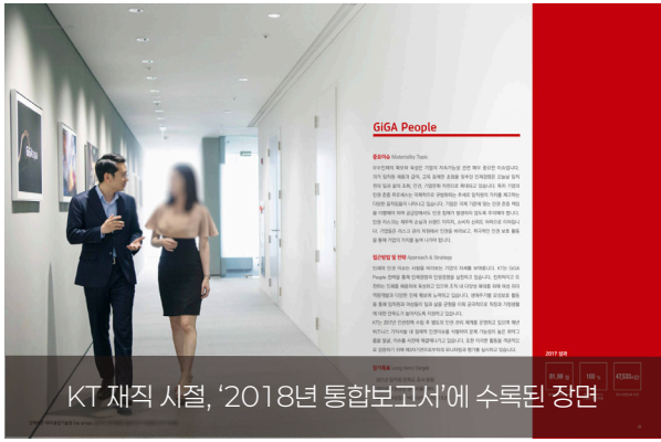
KT 재직 시절, '2018년 통합보고서'에 수록된 장면