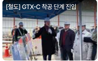
[철도] GTX-C 착공 단계 진입