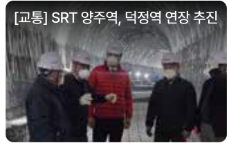
[교통] SRT 양주역, 덕정역 연장 추진