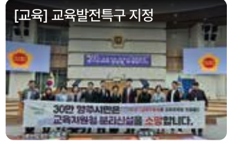
[교육] 교육발전특구 지정