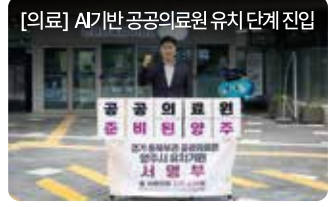
[의료] 시가반 공공의료원 유치 단계 진입