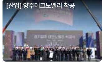
[산업] 양주테크노밸리 착공