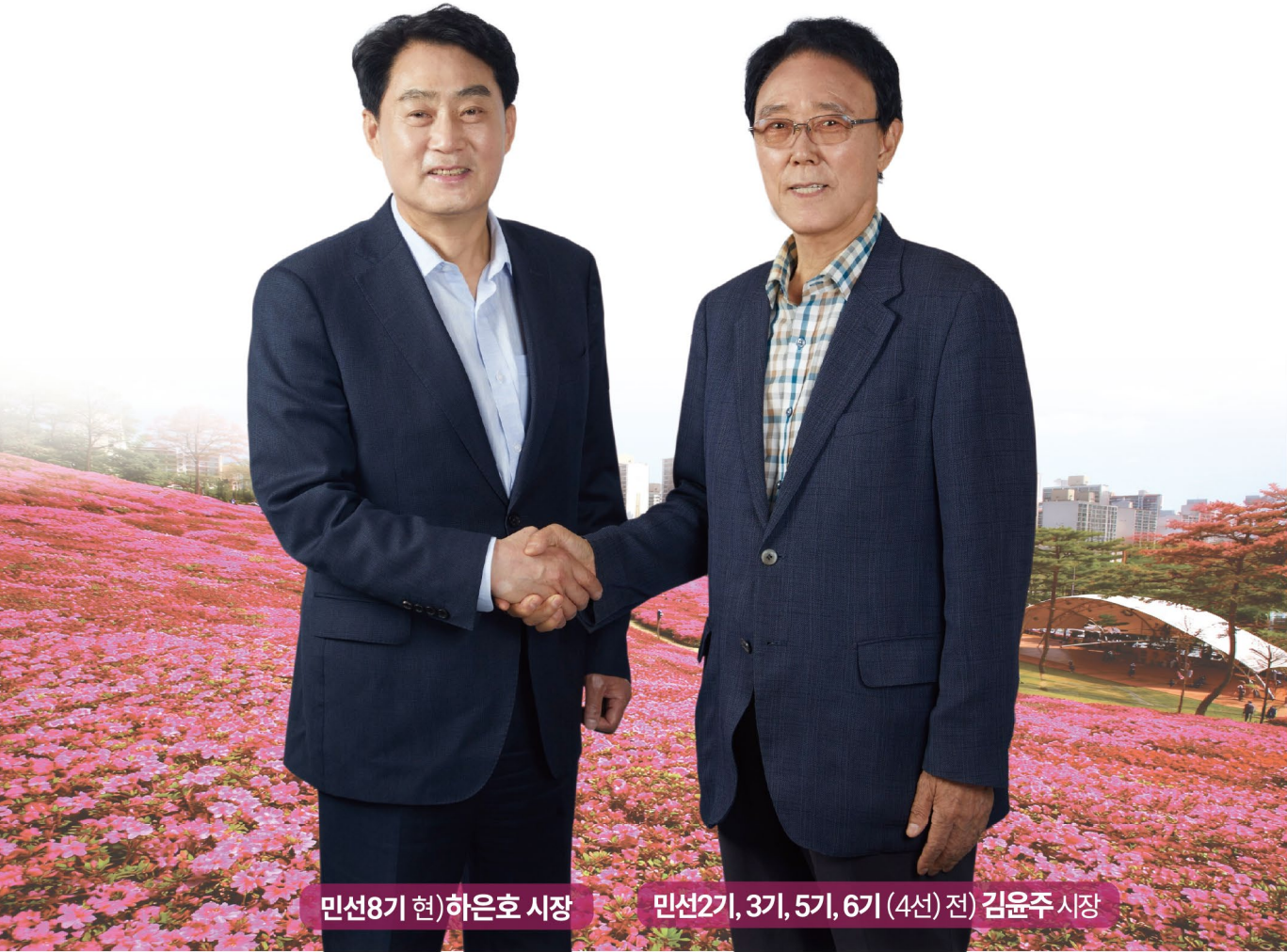
민선8기 현)하은호 시장