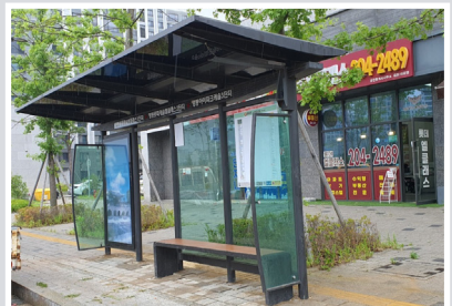
망포동 관내 아파트 입구 버스정류장 설치