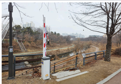
수변공원 안전바 설치