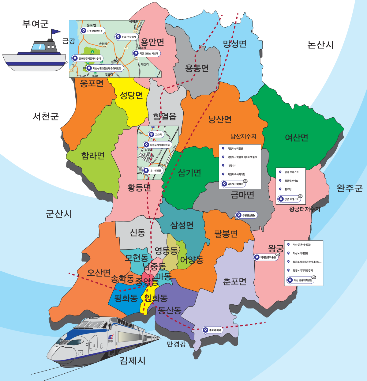
The whole Iksan area... as a tourist city!