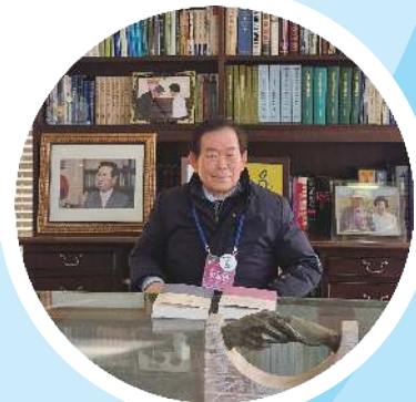
김대중 대통령 책상에서