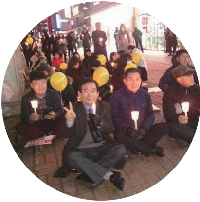
영등동에서... (박근혜 탄핵)