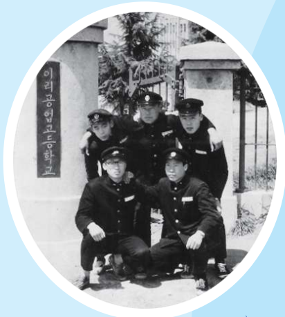
이리공고 시절 (정문에서)