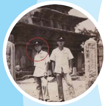
이리공고 시절 (미륵탑)