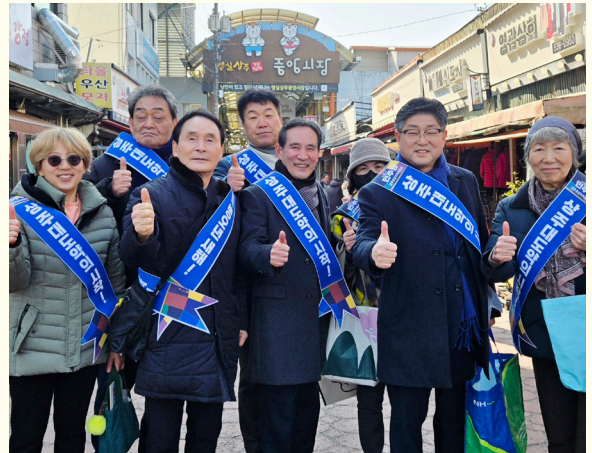
시장 물가 장바구니