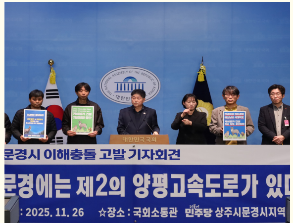
지역 현안 알리기