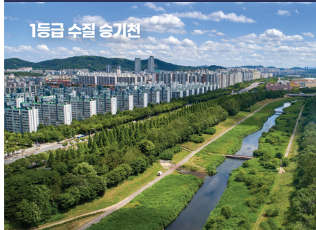
1등급 수질 송기천