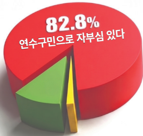
2025년 연수구 구정운영 만족도조사 -여론조사기관 모노리서치 의뢰-