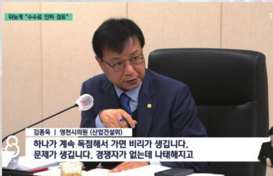
• 24년 12월 영천시 농산물 도매시장 관련 발언 TBC 8시 뉴스 보도