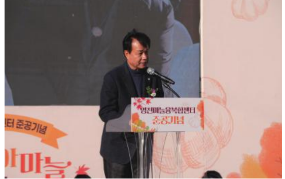
• 25년 11월 영천마늘 응복합센터 준공