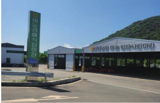
• 24년 6월 신녕농협 마늘 경매집하장 준공