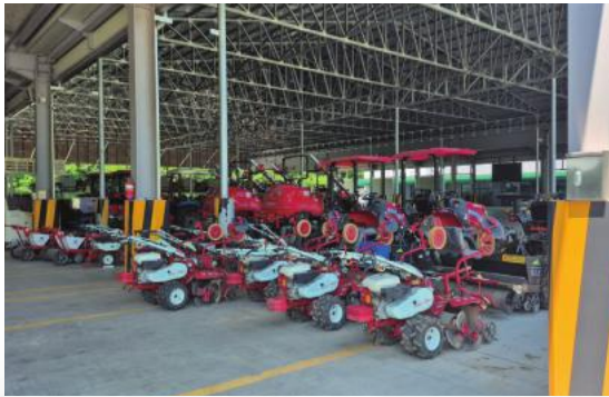
• 24년 6월 마늘전용 농기계 임대 사업 개시