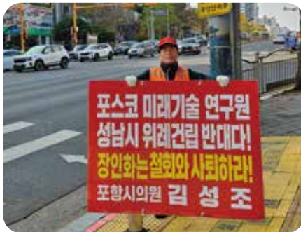
포스코글로벌센터 포항건립 성남반대 1인 시위 활동