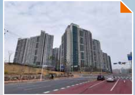
장성동 푸르지오 단지 앞 초·중학교 조기건립 추진