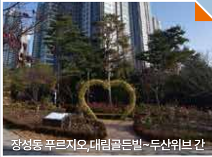
장성동 푸르지오, 대림골든빌~두산위브간 장미조성사업 추진