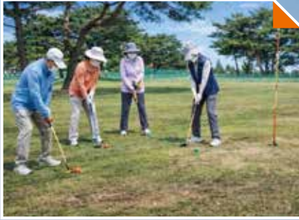
장성동 미군저유소부지 어린이 파크골프장 조성사업 추진