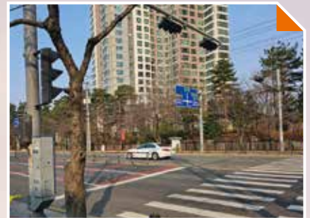
장성동 공공아파트단지 공동체활성화 추진