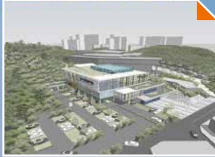
장량동 경북교육청 포항도서관 음악·문화 힐링시설 확보 추진