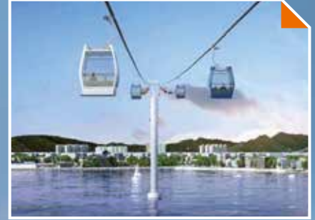
영일대~송도 간 해상케이블카 설치 추진