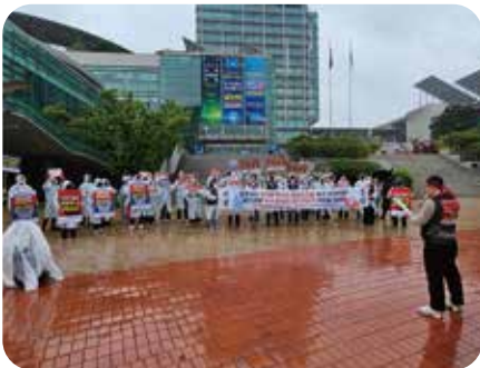
힐스테이트 환호공원 행정구역 편입 주민시위 지지