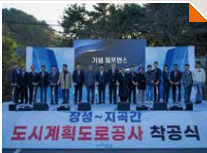
장성동~지곡동(시청)간 도시계획도로 개설 추진중