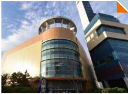
북구지역(장성동) 대형마트 유치·건립 추진