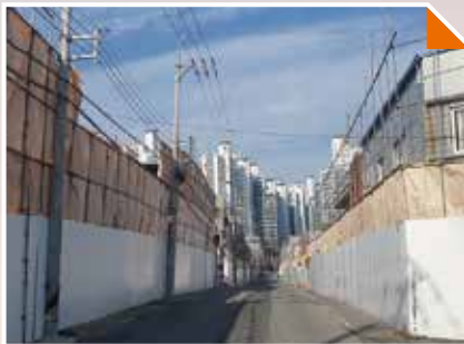
장성동재개발 안전민원해결을 위한 현진에버빌 협의·건의중