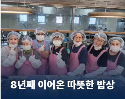
8년째 이어온 따뜻한 밥상

행신복지관에서 8년 넘게 이어온 배식 봉사. 제가 속한 더불어봉사단의 감사패 수상은 주민 여러분이 주신 가장 큰 영광입니다.