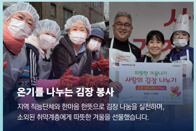
온기를 나누는 김장 봉사

능곡시장 상인들의 목소리에서 답을 찾았습니다. 핵심점포 육성, 특화 콘텐츠 개발, 문화장터 운영 등 능곡시장 브랜드 가치를 높일 실질적인 활성화 방안을 마련을 위해 노력했습니다.