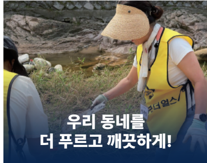
우리 동네를 더 푸르고 깨끗하게!

행신복지관에서 8년 넘게 이어온 배식 봉사. 제가 속한 더불어봉사단의 감사패 수상은 주민 여러분이 주신 가장 큰 영광입니다.