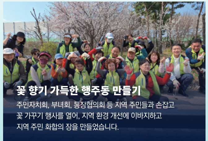
꽃 향기 가득한 행주동 만들기

주민 공동체 '행신누리'와 함께 행신중앙로역 유치 성과를 축하하며, 주민이 직접 기획하고 참여하는 소통의 음악회를 열었습니다.