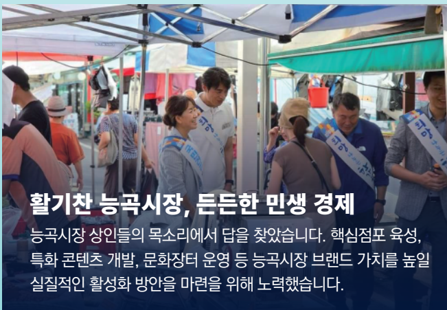
활기찬 능곡시장, 든든한 민생 경제

주민자치회, 부녀회, 통장협의회 등 지역 주민들과 손잡고 꽃 가꾸기 행사를 열어, 지역 환경 개선에 이바지하고 지역 주민 화합의 장을 만들었습니다.