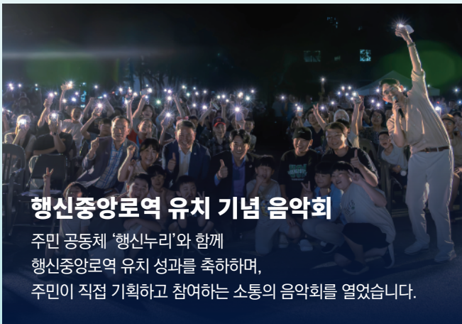
행신중앙로역 유치 기념 음악회

주민 공동체 '행신누리'와 함께 행신중앙로역 유치 성과를 축하하며, 주민이 직접 기획하고 참여하는 소통의 음악회를 열었습니다.