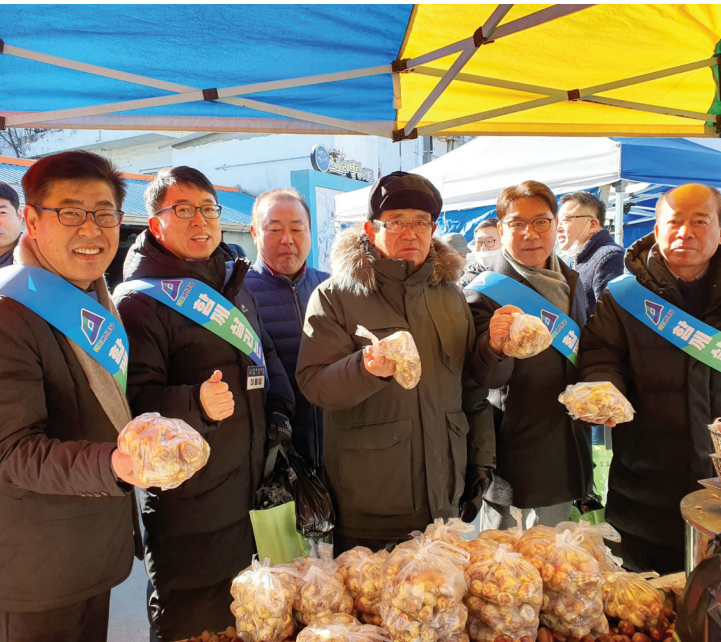
설맞이 전통시장 살리기 캠페인

자원의 한계가 있는 만큼 모두가 만족하는 일을 할 수 없습니다. 그럼에도 어렵고 힘든 사람, 소외계층, 평범한 시민에게 힘이 되고 싶습니다. 지금까지 이러한 의정활동을 펼쳐왔다고 생각하며, 앞으로도 그럴 것입니다. 다시 한번 많은 시민들의 애정 어린 관심과 지지를 부탁드립니다.