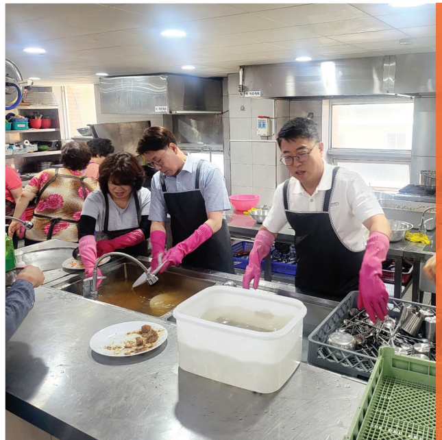
저소득층 식사 및 설거지 봉사

9대 천안시의회의 의원으로 활동하면서 지역구 곳곳을 발로 뛰며 현안을 해결하려 노력했습니다. 여성, 장애인, 노인, 아동 등 사회적 약자의 권리를 옹호해왔습니다