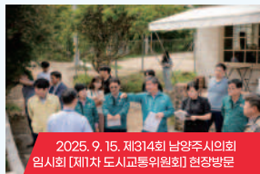
2025. 9. 15. 제314회 남양주시의회 임시회 [제1차 도시교통위원회] 현장방문