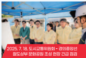
2025. 7. 18. 도시교통위원회 - 경의중앙선 철도상부 문화공원 조성 현장 긴급 점검