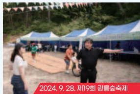
2024. 9. 28. 제19회 광릉숲축제