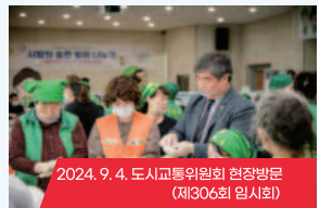
2024. 9. 4. 도시교통위원회 현장방문 (제306회 임시회)