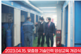
2023.04.15. 맞춤형 기술인력 양성교육 개강식