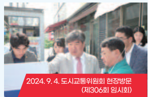
2024. 9. 4. 도시교통위원회 현장방문 (제306회 임시회)