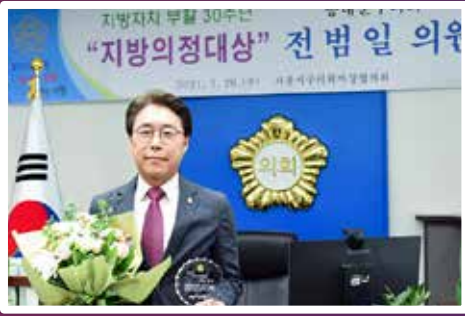
▲ 의정대상 수상 (21.5.26)