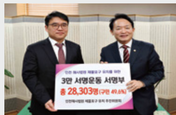
해사법원 서명부 전달