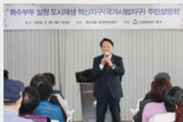
화수부두 일원 도시재생 혁신지구 주민설명회