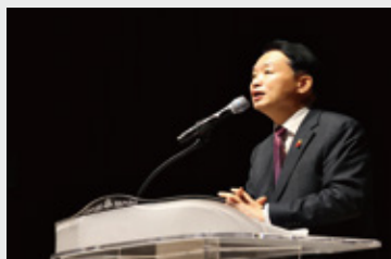
제물포구 출범 주민설명회