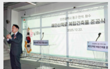
만석·화수해안산책로 복합건축물 준공식