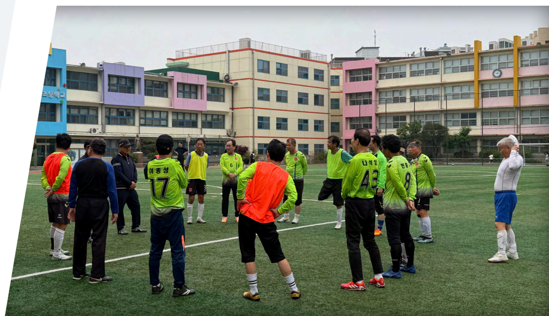
영신초등학교 인조잔디 조성