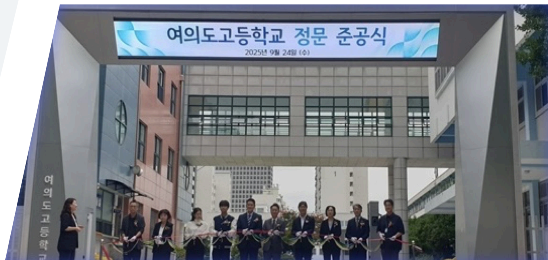
여의도고등학교 정문 준공식