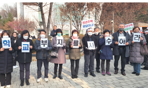
마천지구 학교부지 존치 확정