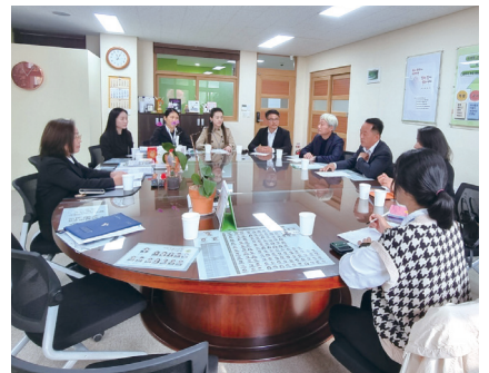
과밀학급 해소, 학부모간담회