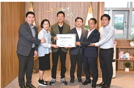
위례주민대표단 서울시장 면담 추진