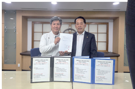
위례과천선 연장 청원, 시의회 의결