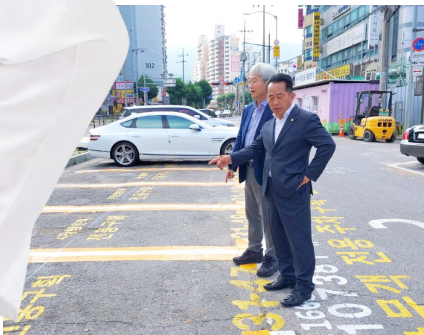
마천시장 주차장 조성