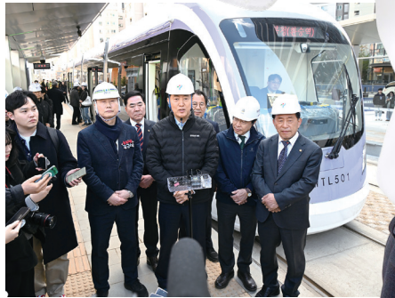
위례선 트램, 조속 완공 추진(현장방문)