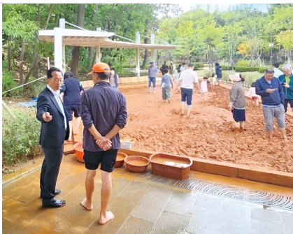
옛숲공원 황토체험장 신규 조성