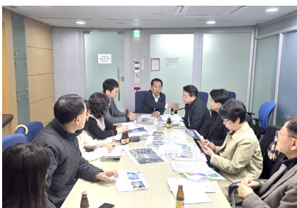
장지 공영차고지 주민간담회