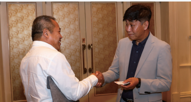
한중국제교류협회 중국 지린성 방문 (제4회 동북아지방협력원탁회의, 인민대표대회 방문)