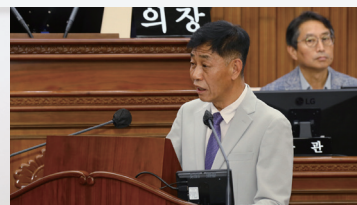
도정 및 교육행정에 관한 질문