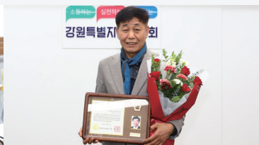
강원특별자치도의회 의원연구회 감사패 수여식