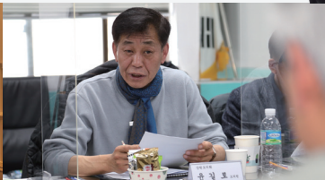
시멘트 공장지역 환경과 주민건강 연구회 현지시찰