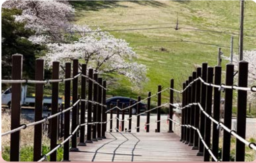
달려있던 길, 새로운 랜드마크 서산한우목장길 개방