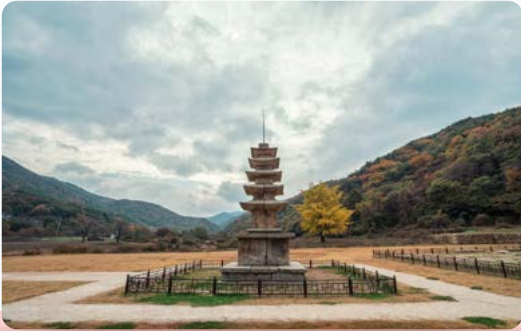
63년만에 두번째 국보 탄생 보원사지 오층석탑 국보 승격