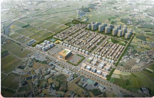
입체적 도시확장 수석지구 도시개발 사업 착공