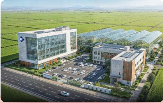
대한민국 융합그린바이오의 거점 한국생명공학연구원 분원 유치