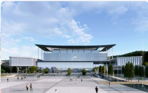
서산의 내일을 여는 시청사 건립 입지 선정