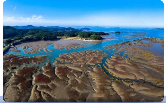
대한민국 제1호 지정 가로림만 국가해양생태공원