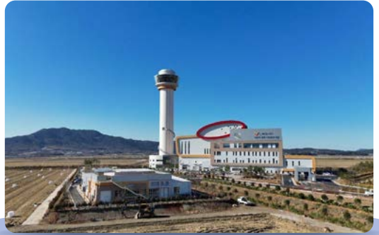
친환경 관광체험시설 자원회수시설 준공