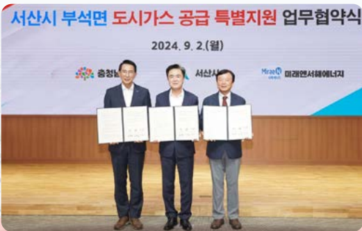
에너지 복지 향상 도시가스 순차적 공급