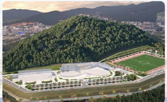
기업과 지역사회의 동반성장 대산 안산공원 조성사업 착공