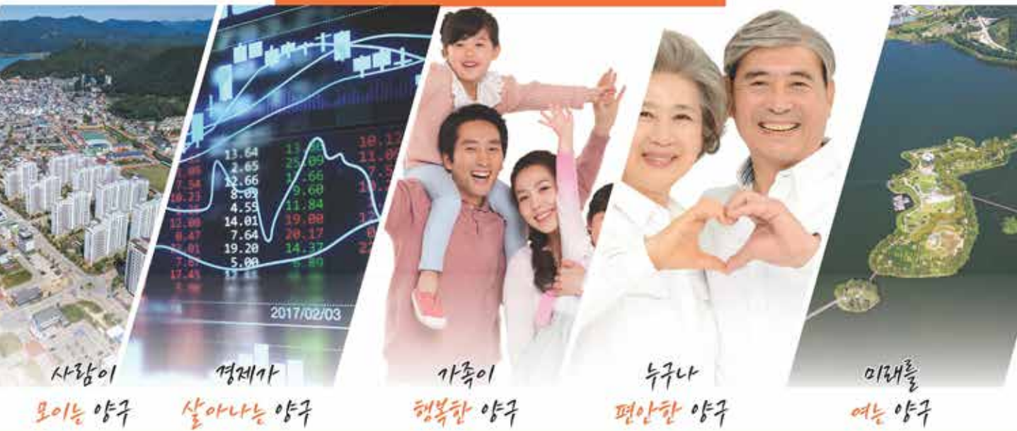
사람이 모이는 양구