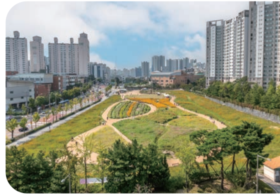
☑ 지식의 꽃밭