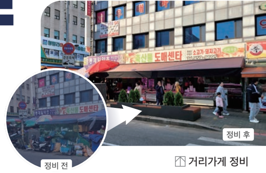
☑ 거리가게 정비