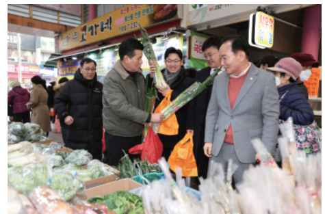
▶ 전통시장 장보기 행사