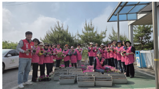
▶ 오송읍 꽃심기