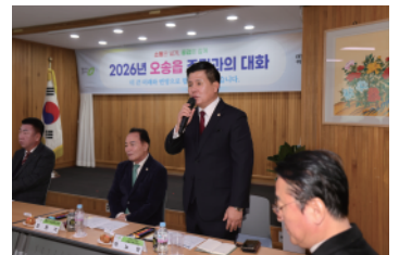
▶ 오송읍 주민과의 대화