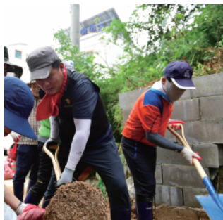
▶ 수해복구 봉사활동