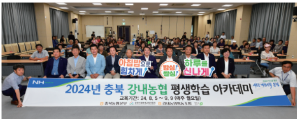
▶ 강내농협 평생학습 아카데미

마을하수도, 배수로 등 정비가 미비한 지역에 지역 배수불량으로 인한 피해예방 등 생활환경 개선