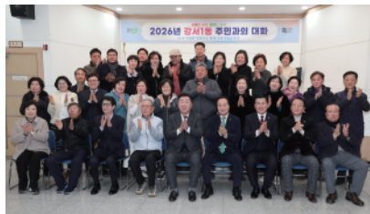
▶ 강서1동 주민과의 대화